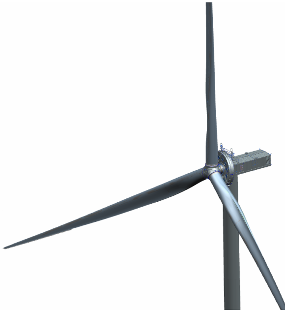
Abb. 1: Produktübersicht

Die Windenergieanlage erzeugt elektrische Energie aus Wind. Der anströmende Wind bewirkt, dass der Rotor sich im Uhrzeigersinn dreht. Die Drehbewegung wird in elektrische Energie umgewandelt. Die Windenergieanlage arbeitet automatisch.